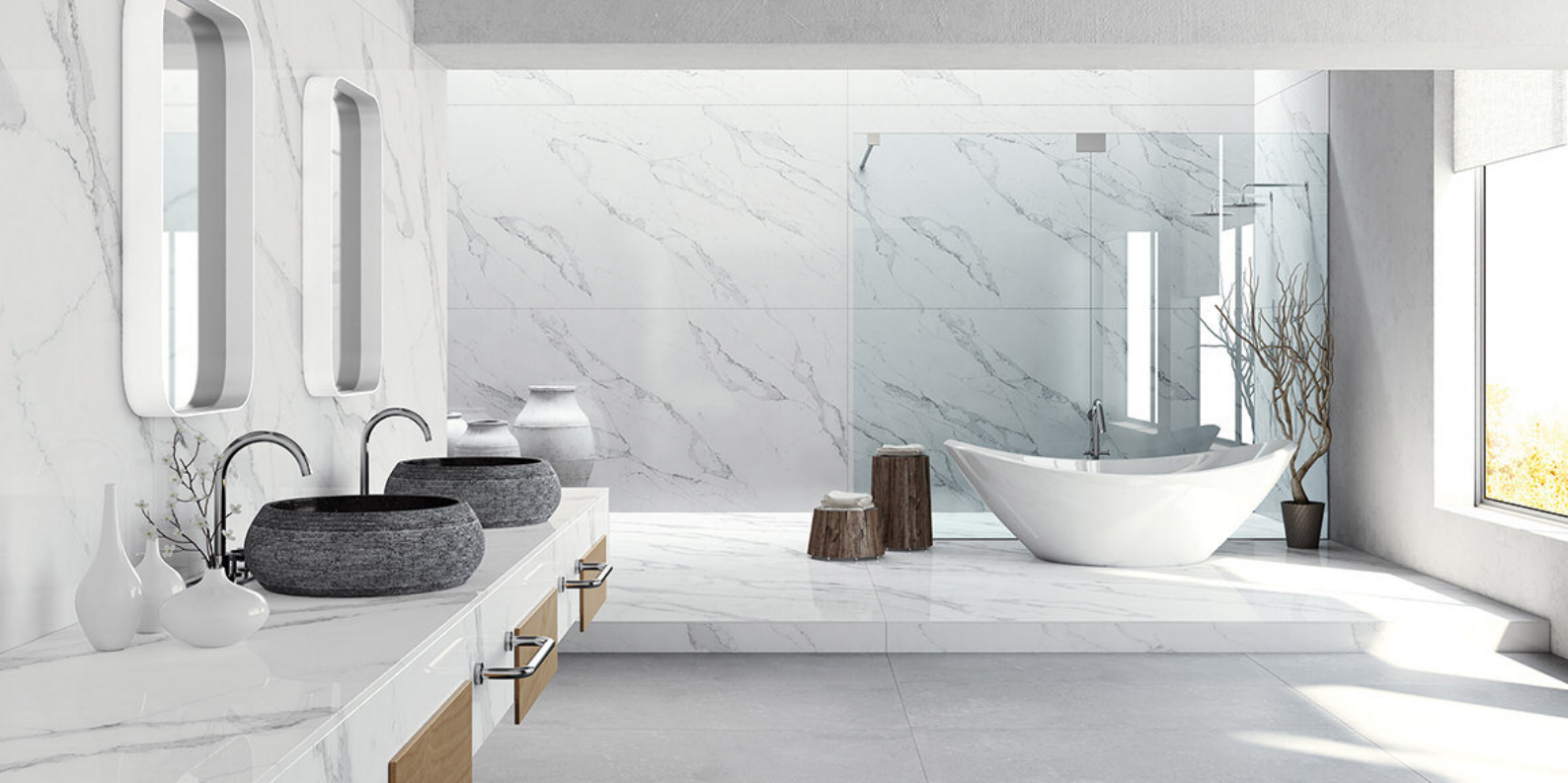
COMPAC® Unique Calacatta