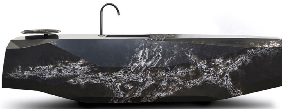
Quartz Rock Monoblock Kücheninsel aus COMPAC® Ice Black by Arik Levy

Aus dieser Art des Denkens und Handelns - die wir « Minds over Matter » nennen - entstehen so unglaubliche und leidenschaftliche Projekte wie unsere Zusammenarbeit mit dem Künstler und Designer Arik Levy , dem es immer wieder gelingt, Materie in etwas Echtes und Unvergessliches zu verwandeln um die anspruchsvollsten Kunden weltweit zu inspirieren.